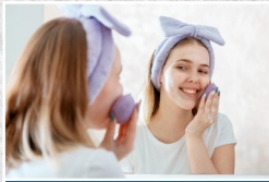
Hudpleje der dur