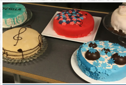
Det store bagehold