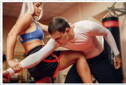
Selvforvar for piger