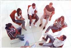
Politik-på den sjove måde