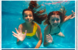
Games and Watersports