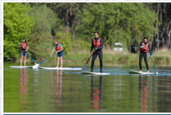
Havkajak / SUP