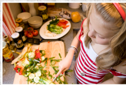
Mad for begyndere