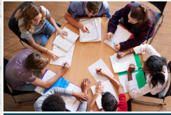
FagCafe - lektiehjælp